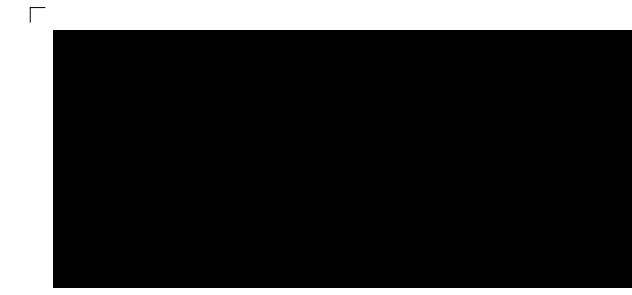
9853 | rabe . raven