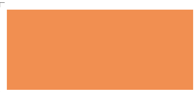
9922 | aprikose . apricot