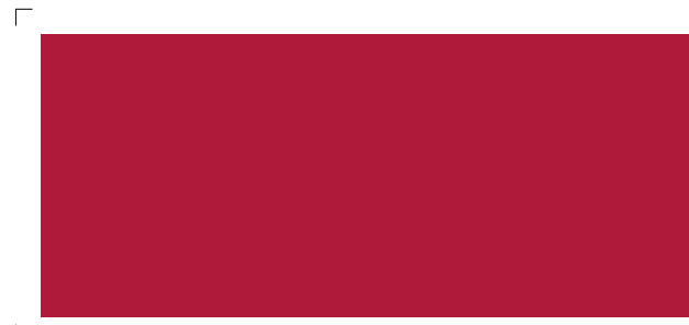
9675 | chili . chili