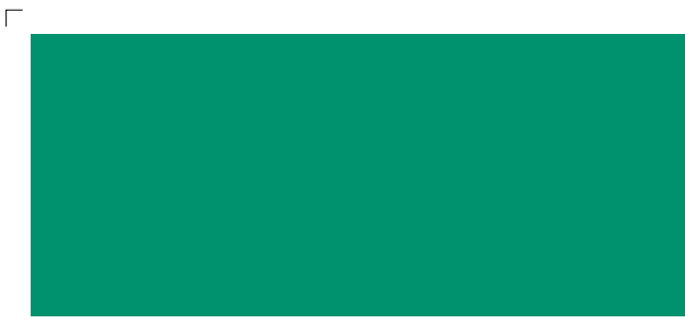
9767 | smaragd . emerald