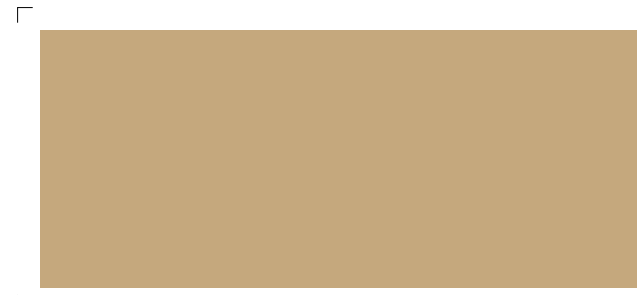
9816 | sesam . sesame