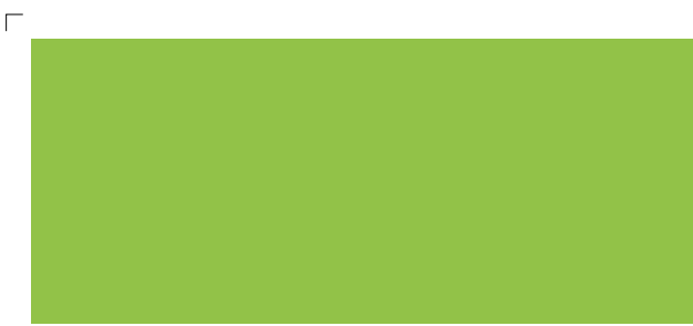
9926 | limette . lime