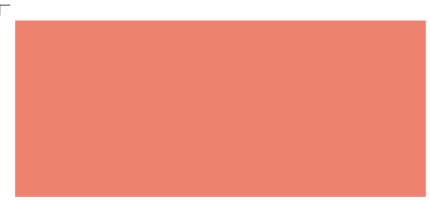
9932 | lachs . salmon