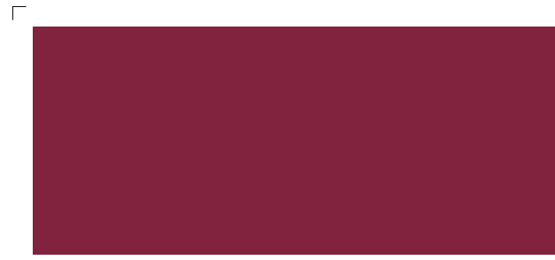
9879 | merlot . merlot