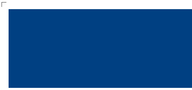
9545 | mitternacht . midnight