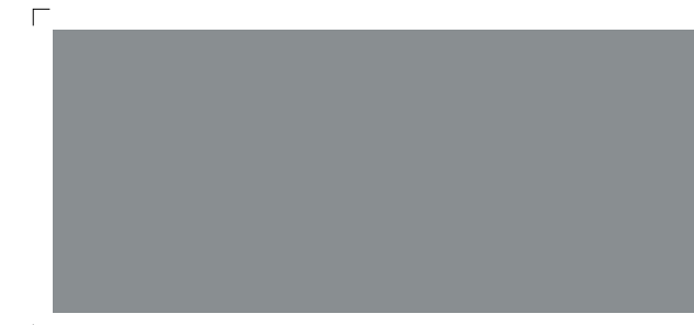
9665 | gewitter . thunderstorm