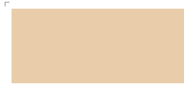
9875 | strand . beach