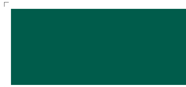
9710 | wald . forrest