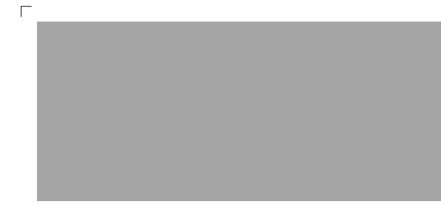
9801 | beton . concrete