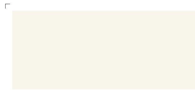
9937 | mond . moon