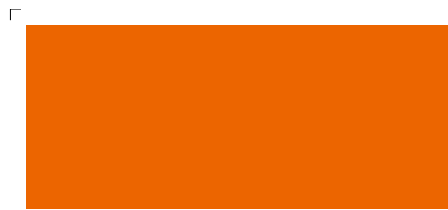
9527 | karotte . carrot