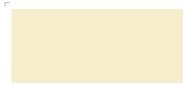
9947 | champignon . mushroom